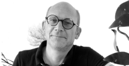
Emmanuel de Cockborne Sculpteur métal http://emmanueldecockborne.art/