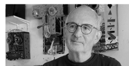
Pascal Leroy Plasticien https://www.leroypascal.com/